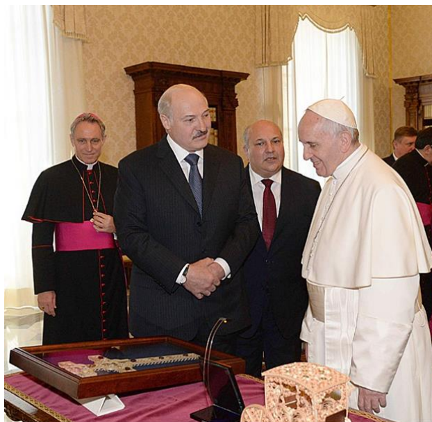
Рис. 5. Президент Республики Беларусь Александр Григорьевич Лукашенко и Папа Римский Франциск во время встречи в Ватикане, 21 мая 2016 года.

Сербскому Иренею в 2014 г., в 2016 г. Жировичская Икона Божией Матери была вручена Папе Римскому Франциску во время визита в Ватикан (Рис. 5).