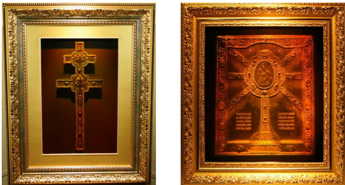
Рис. 2. Внешний вид голограмм «Крест Преподобной Евфросинии княжны Полоцкой (слева) и «Жировичская икона Божией Матери» (справа)