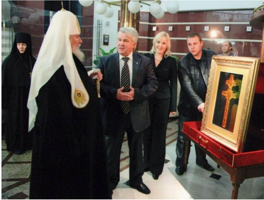
Рис. 3. Его Святейшество Патриарх Московский и всея Руси Алексий II благословляет коллектив ООО «Магия света» на дальнейшие работы в области использования голографии для сохранения сокровищ православия

Энергетика голографических образов оказалась такой, что с благословения митрополита Минского и Слуцкого, Патриаршего Экзарха всея Беларуси Филарета, Крест Преподобной Евфросинии княжны Полоцкой был передан в Храм Покрова Пресвятой Богородицы в Минске (Рис. 4) и является предметом поклонения наравне с писаными классическими иконами.