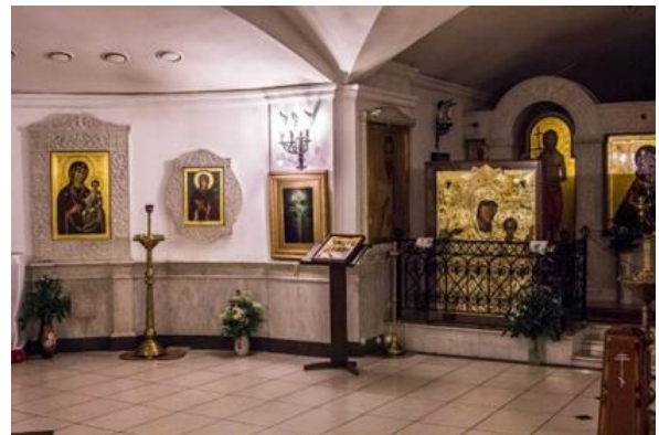
Рис. 4. Храм Покрова Пресвятой Богородицы, где находятся художественные голограммы – Жировичская Икона Божией Матери, справа – Крест Преподобной Евфросинии княжны Полоцкой

Голограммы вскоре вышли на международный уровень. Оптическая копия Креста Преподобной Евфросинии княжны Полоцкой была вручена Президентом Республики Беларусь Александром Григорьевичем Лукашенко во время его визита в Сербию Патриарху